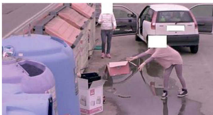
Uno smaltimento abusivo ripreso dalla telecamera a Figline

QUARANTAQUATTRO notificate per un totale di 7.040 euro, e diciannove in fase di notifica: sono queste le contravvenzioni elevate dalla Polizia Municipale di Figline e Incisa per le violazioni alle regole previste per lo smaltimento dei rifiuti. Si tratta di rilevamenti effettuati dalla telecamera mobile, infrazioni di tipo ambientale sanzionate con multe da 160 euro ciascuna, multe 'testimoniate' dalla videosorveglianza entrata in funzione da quattro mesi. Quelle già notificate sono riferite ai mesi di febbraio e marzo nell'ecostazione del piazzale della Misericordia a Figline, mentre le altre in 'preparazione' sono state rilevate la prima settimana di aprile presso i cassonetti di via Romania, sempre grazie all'occhio elettronico che ha registrato l'infrazione e il relativo autore. «Sia la telecamera usata nel piazzale della Misericordia, che quella usata in via Romania - ha spiegato Alessio Pasquini comandante della Polizia Municipale -, rientrano nel più ampio progetto di videosorve-