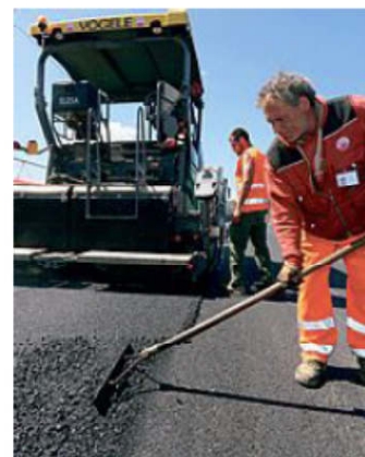
Lavori di asfaltatura